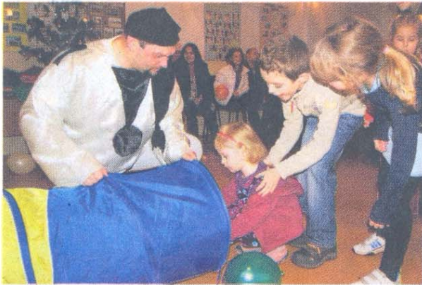
To było wyjątkowo sympatyczne spotkanie w prawdziwie bajkowym klimacie.