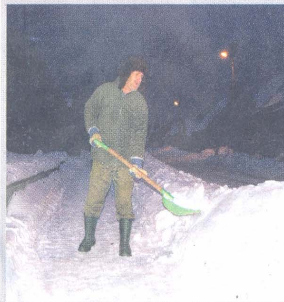
Oby takich mieszkańców w naszej gminie nie zabrakło.

Podczas tegorocznej zimy poranki zawiane i zasypane śniegiem po łydki zaskoczyły nas wiele razy. Na szczęście, mimo niesprzyjających warunków atmosferycznych, widok należycie odśnieżonych chodników i naszych mieszkańców zmagających się od bladego świtu z nadmiarem śniegu nie był rzadkością. Za co należą się serdeczne podziękowania.