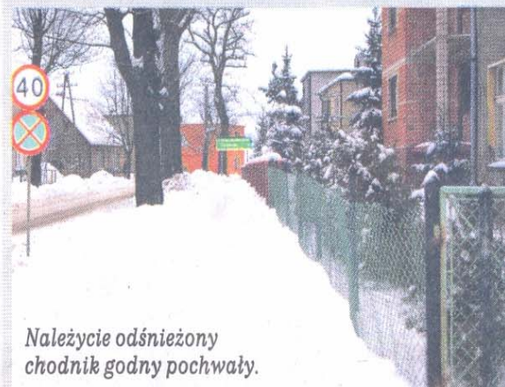
Należycie odśnieżony chodnik godny pochwały.

Podczas tegorocznej zimy poranki zawiane i zasypane śniegiem po łydki zaskoczyły nas wiele razy. Na szczęście, mimo niesprzyjających warunków atmosferycznych, widok należycie odśnieżonych chodników i naszych mieszkańców zmagających się od bladego świtu z nadmiarem śniegu nie był rzadkością. Za co należą się serdeczne podziękowania.