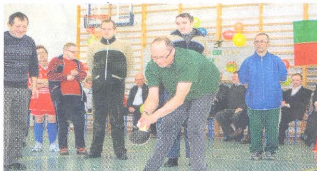
Zawodnicy mieli okazję zaprezentować się również w dodatkowych konkurencjach zaproponowanych przez organizatorów.