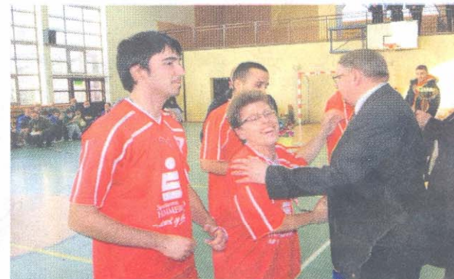
Drużyna DPS Rzakdkowo zajęła VI miejsce.